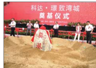
科达·璟致湾城项目奠基仪式现场

绝版的区位优势、合理的社区规划、精细的户型设计、高标准的建设和优质的社区服务,科达·璟致湾城必将以地标级的建筑精品身份,成为滨州市的楼盘标杆,不断引领当地房地产市场,开创城市精致大盘时代。