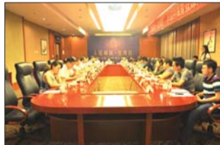
中海壹号滨州媒体见面会顺利召开。

据悉,中海壹号项目一期将于今年年底面市。相信未来中海壹号项目必定会以其高端的品质和独特的湾区价值为滨州人所热爱,引领滨州高端人居之潮流风向。