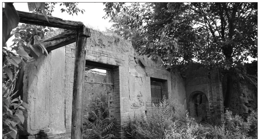
东跨院已破败不堪。丁家南六院东大门内的