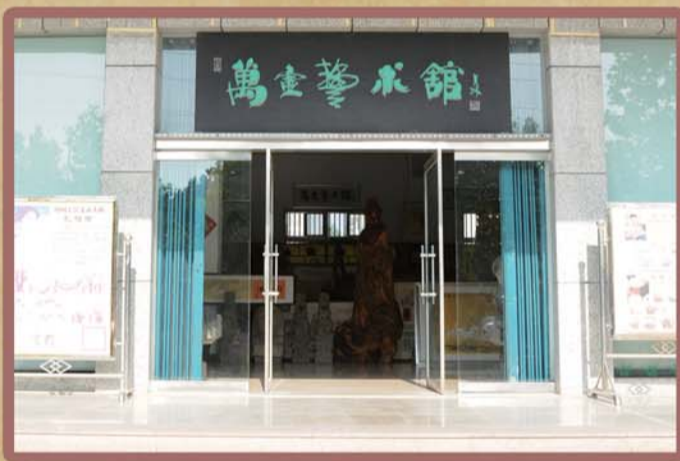
桓台县万壶艺术馆

在壶形创作上吸收了传统经典壶式的设计理念或造型元素，用现代审美观点进行重新诠释，即：长方合欢提梁（传统合欢提梁壶的元素）；提角重权（传统秦权壶的理念）；浑方集玉（集玉壶的理念）；阳羨风骨（传统传炉壶的元素）；龙凤石瓢（传统石瓢壶的元素）。