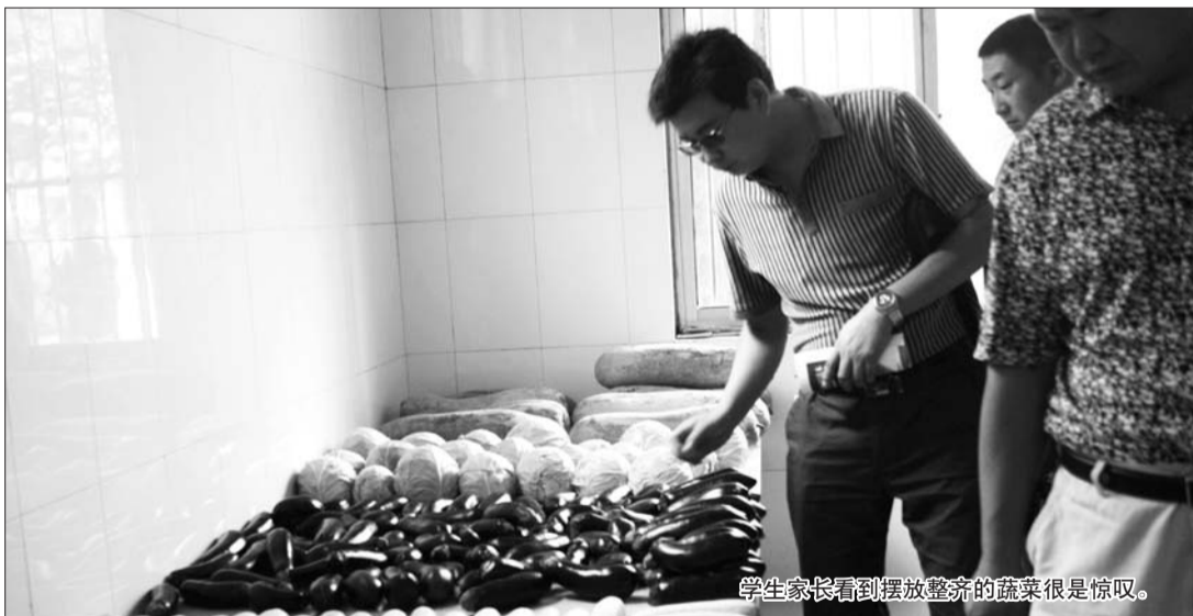
学生家长看到摆放整齐的蔬菜很是惊叹。

本报枣庄6月30日讯(记者 甘倩茹 通讯员 陈龙) 27日上午十时,滕州二中的学生家长参观了滕州二中南北两个食堂,从更衣室到饭菜上桌等待售卖,全过程的观看让家长对学生学校就餐环境更放心。这也是滕州食品药品监督管理局