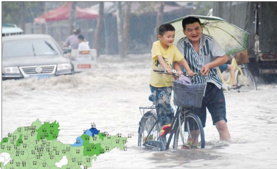
▲2日,菏泽康庄路与解放大街,市民在积水中前行。

据省气象台预报员介绍,3日白天我省局部地区可能还有零星降雨,大部分地区天气将是转多云的过程,到3日晚间本次降水过程基本结束。4日凌晨时分开始的另一场大范围降雨,将主要集中在中南部地区。