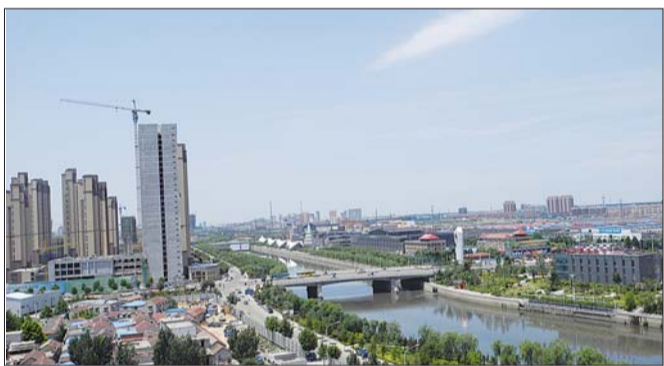
2日,位于济南北部的小清河,在蓝天下显得格外清澈。