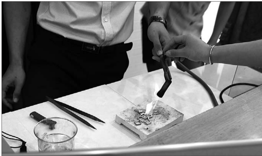
金饰在1000℃的高温下进行检测。

另外,部分品牌在金价波动过程中,通过加工费的优惠促销代替金饰价格的下调。比如日照百货大楼德福莱首饰、老凤祥、百世缘、老庙黄金千足金的价格都是348元/克,但是德福莱首饰以及百世缘专柜的金饰促销免收加工费,而老凤祥的金饰加工费仍按原价收取,这样一件10克金饰的总价格就会有几百元的差价。