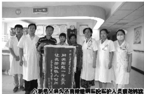
小朝霞父亲为济南哮喘病医院医护人员赠送锦旗。