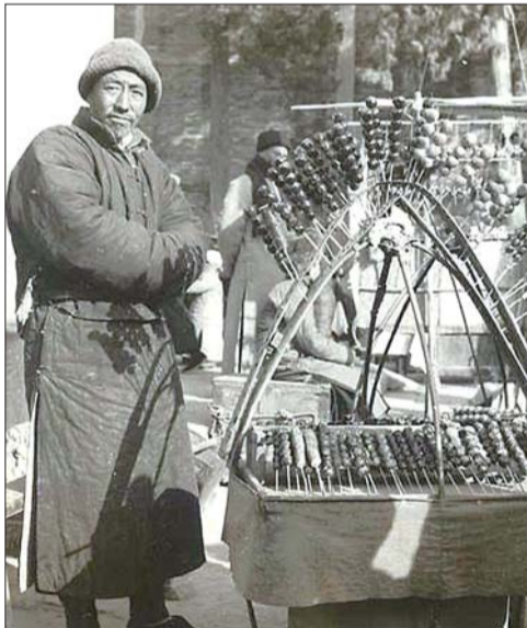
旧时女郎山庙会上卖糖葫芦的小贩。