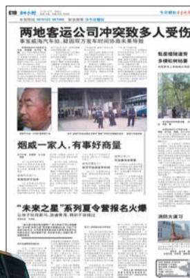
◀ 本报关于烟威两地客运公司的相关报道。

7月5日,本报以《两地客运公司冲突致多人受伤》为题,报道了7月1日威海汽车站院内,威海汽车站工作人员与烟台北明客运公司旅游汽车站威海车队发生冲突一事,事件造成双方十多人受伤。造成冲突的主要原因是双方对发车时间分配及协商方式存在争议,到底是咋回事?记者进行了进一步调查。