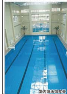
宝岛名品商行店内游泳馆实景图。