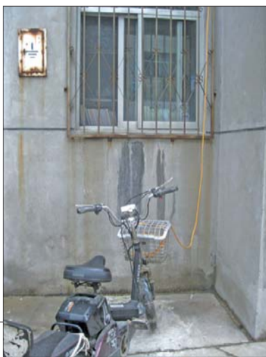
在聊城建筑一公司家属院,有居民从楼上扯线到楼下给电动车充电

本报聊城 7 月 14 日讯(见习记者 王瑞超) 在聊城建筑一公司家属院,因为没有储藏室,小区居民从楼上扯线到楼下给电动车充电,居民知道这有安全隐患,但这么做实属无奈。