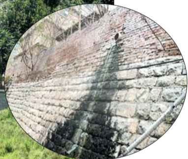
治理前,兴济河上有不少排污口。