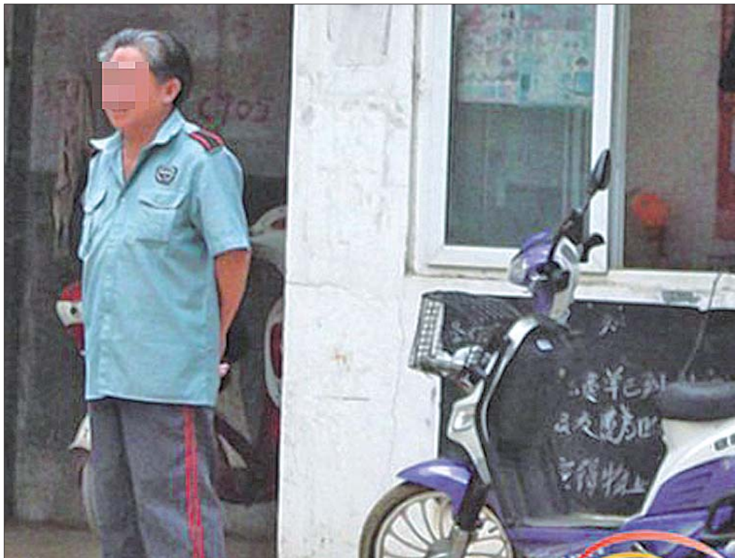
老小区保安老龄化现象比较普遍。(资料片)

连日来,不少市民反映小区保安年龄过大,可能会造成小区安全的隐患,同时业主对其安保能力提出质疑。随着大量封闭式小区的出现,小区保安与市民关系密切起来,小区安全也更加令人关注。小区保安为什么越来越老?到底有无年龄限制?7月13日,记者走访了章丘多个小区,了解到“4050”的保安居多,部分小区保安老龄化现象尤为突出。