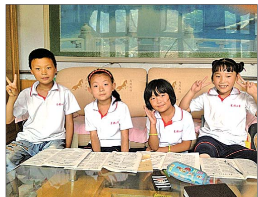
孩子们互助学习很快乐。

本报7月15日讯(见习记者 赵克 通讯员 侯启辉) 14日,记者在文祖镇东张村发现,当地农村小学针对留守儿童较多的实际情况,建立了暑假学习互助小组。小组成员就近成组,共同学习,共同游戏,欢度暑假。