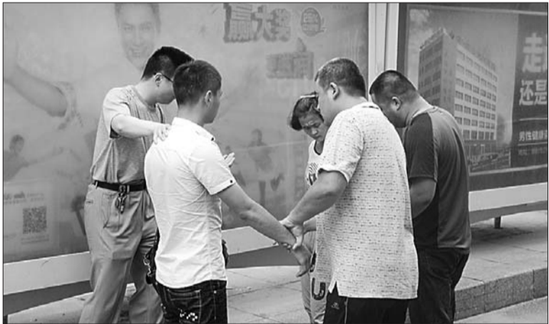
反扒民警抓获一对可疑男女。

在他们的手提包内,除了几个硬币和手帕纸外,什么东西都没有。“凭反扒经验,这些空包通常是用来作案的掩护工具。”民警介绍,随后他们还要进一步调查。