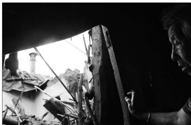
村民姜登领的民房整个倒塌了一间。

据了解,龙口市有6个镇街遭受洪涝灾害,受灾人口1200人,紧急转移安置受灾群众3人,农作物受灾面积86.6公顷,成灾面积40公顷,倒塌房屋6间。