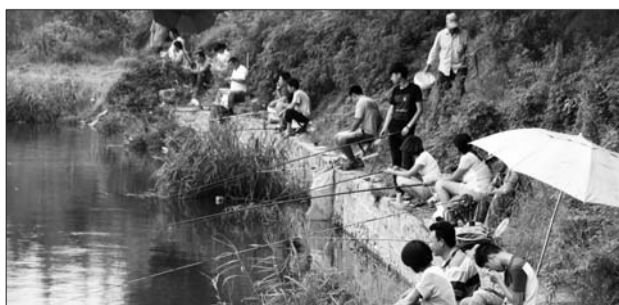
大雨过后,到水库钓鱼的村民和游客有二十多人。