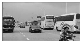
游乐园外的旅游车排了近1公里。

在海滨路上某试营业的休闲乐园,门里门外都异常火爆。记者从该休闲乐园市场部一名苗姓工作人员处了解到,这个难得的晴天让乐园的顾客爆满,当天截至下午4点半,已经近1万名顾客前去游玩。而在上周五,才只有两三千人次。上周六,虽然是周末,顾客有所上升,但也仅为5千人次左右。