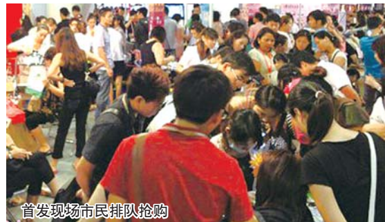
首发现场市民排队抢购

有太阳系星球,火箭飞天图案,及“2013”年号,国际造币技术铸造,999黄金雕琢表面,尊贵大气,每枚都极具收藏投资价值。