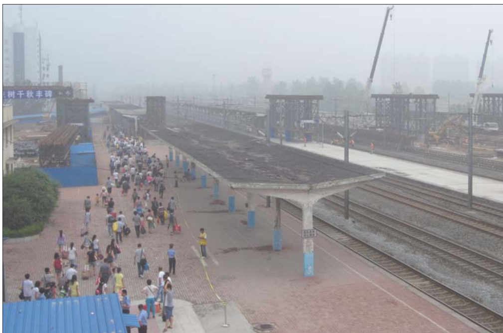
天桥立柱开始施工建设

菏泽火车站客运副主任薛萍告诉记者,计划将于9月底,3号、4号站台投入使用。与此同时,4个站台中间分别立起来钢结构框架,几辆工程车仍在施工。据了解,这几个钢结构是旅客进站天桥。天桥建设的位置正对出站口,将出站口与站台连接。建成后的天桥宽为12米,以满足旅客进站需要,同时与出站通道分离开来,方便旅客进出站。