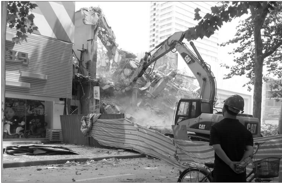
▲淄博剧院周边建筑开始拆除。

建成后,新的剧院将是一个可容纳1200人标准的中型剧场,可满足各类专业文艺演出。