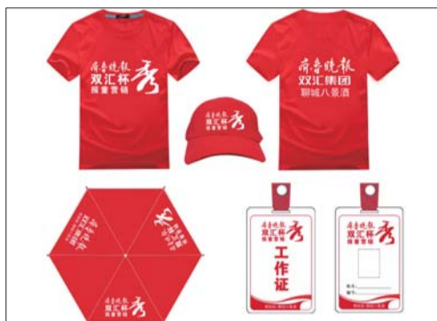
本报将为小选手提供的装备。

参与活动的小报童每人可免费获得30份齐鲁晚报(价值15元)作为启动资金。主办方为每名小报童免费提供T恤衫、太阳帽和雨伞等物品。30份报纸卖完后,小报童根据自己的能力再批发齐鲁晚报