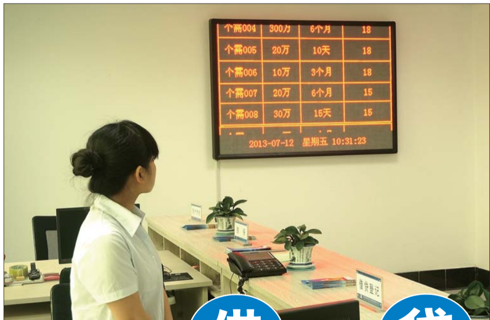
▲恒信中心大厅里的电子屏上滚动着借贷信息。

2012年底,东营市在所辖三县两区各设立一家民间借贷服务中心,半年时间,这5家民间借贷服务中心登记需求资金563笔,金额5.91亿元;出借499笔,金额3.16亿元;对接成功226笔,金额2.11亿元,借贷满足率为35.7%。