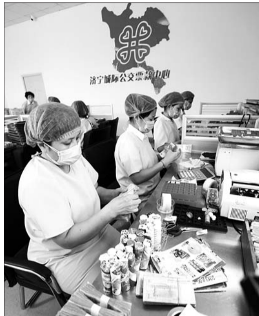
点钞员认真清点票款。

作为一名点钞员真心希望乘客能尊重驾驶员与点钞员们的劳动成果, 文明乘车、规范投币。