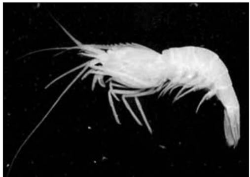
深海采集的阿尔文虾。

记者获悉,在“蛟龙”号试验性应用航次第一航段中,首次搭载科学家的“蛟龙”号载人潜水器对深海进行了观察,并获取了大量冷泉区与海山区生物、地质方面的照片和视频资料。