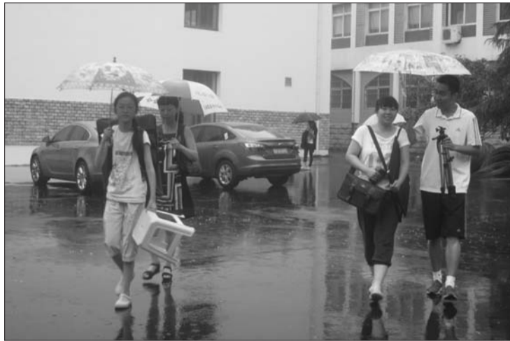
16日,考生拎着考试道具走出考场。