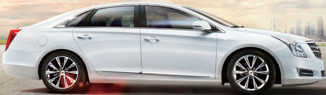
Brad Pitt 布拉德·皮特

凯迪拉克豪华轿车XTS「双免尊享礼遇」倒计时进行中 34.99万起 德美系中高级豪华车价值新标杆