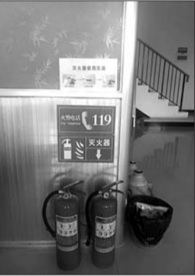
建成96个消防示范街

艾滋病检测有望覆盖县乡 本报聊城7月17日讯(记者 王尚磊 通讯员 梁勇) 17日,记者从聊城市疾控中心获悉,目前聊城市、县、乡艾滋病检测网络初步建成,市疾控中心把全市乡镇医疗机构艾滋病检测点建设工作纳入项目管理,鼓励全部乡镇医疗机构、社区卫生服务站筹备HIV检测点创建工作。