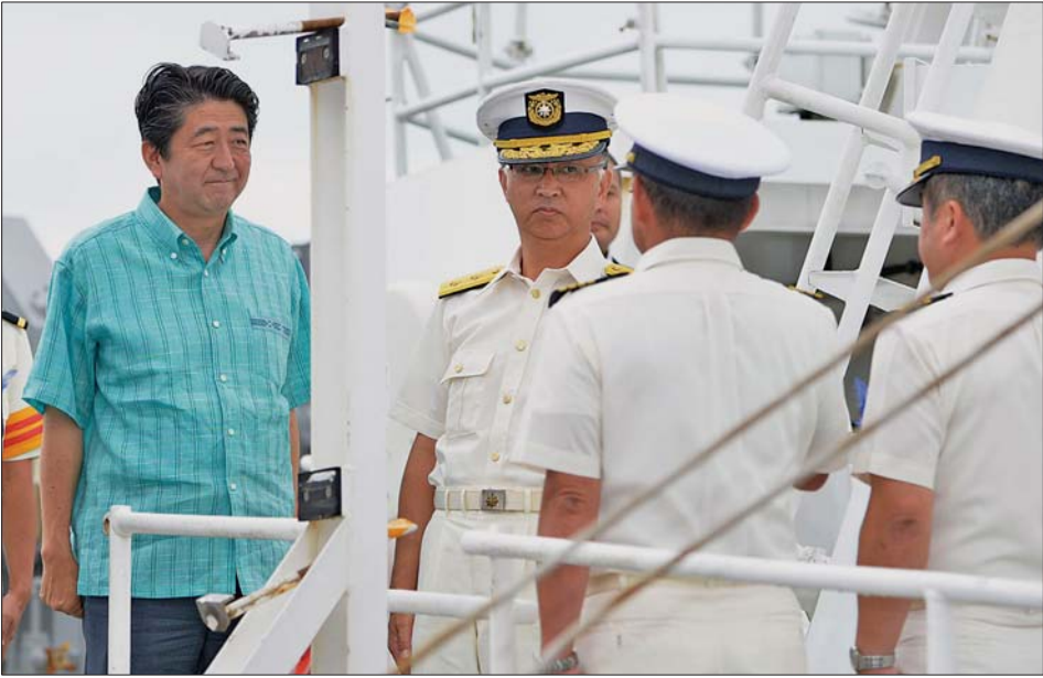
▲17日,在日本冲绳县石垣岛,日本首相安倍晋三(左一)视察海上保安厅的巡视船。

宫古岛与冲绳本岛之间的海域是中国海军进出太平洋的必经之路,战略地位十分重要。日本航空自卫队宫古岛基地担负着监控东海和钓鱼岛周边海空领域的任务,是自卫队主要的一支钓鱼岛防御部队。 据中新社