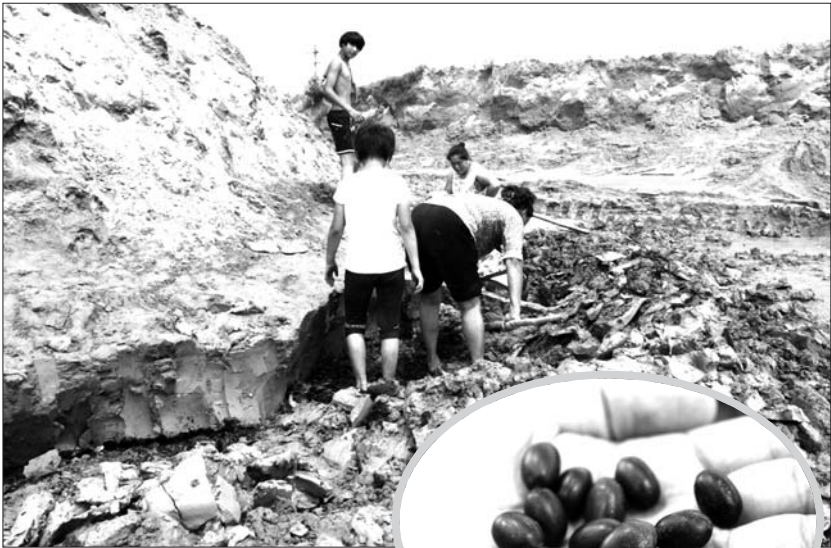
▲村民们正在寻找、挖掘莲子。 ▶村民挖出来的莲子。