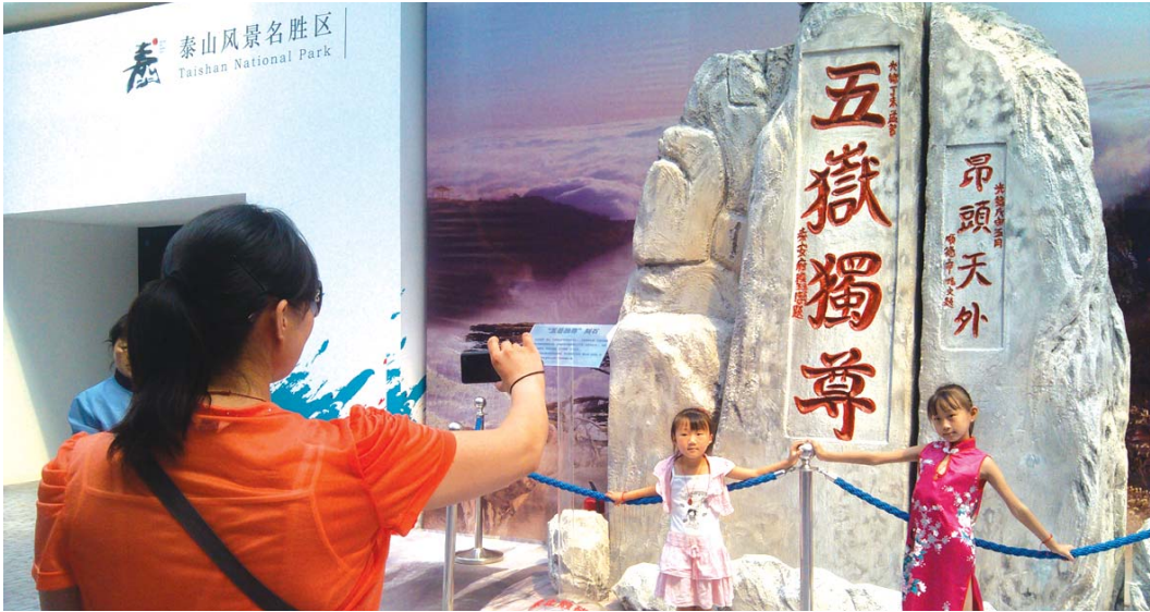
游客在五岳独尊刻石复制品前拍照留念。

本报北京7月17日讯 (记者 邵艺谋) 17日,泰山景区在中国风景名胜区协会主办的“美丽中国 江山风情”风景文化展展出,实景还原的孔子登临处牌坊、五岳独尊等经典景点,一经亮相就吸引很多游客合影留念。据了解,这是泰山景区首次在京参加展览,将持续展出半年。此次展出也将让更多人了解泰山,认识泰山。 17日下午,由中国风景名胜区协会主办的“美丽中国 江山风情”,在国家游泳中心水立方拉开帷幕。