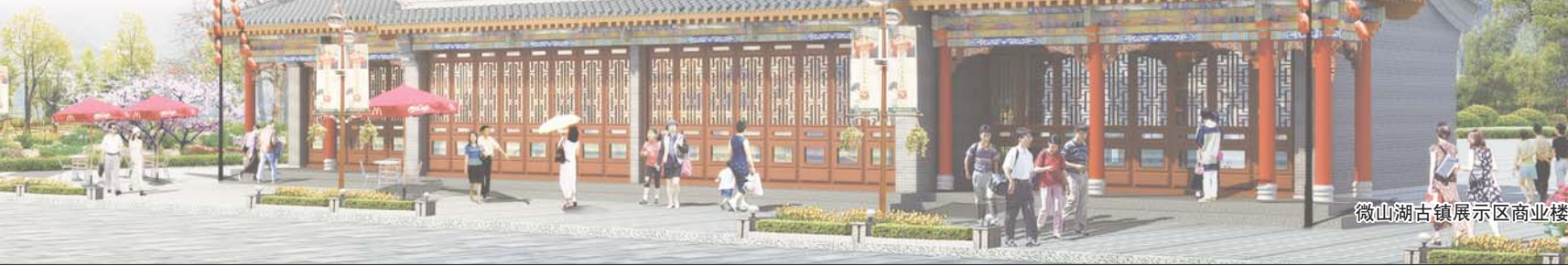
微山湖古镇展示区商业楼