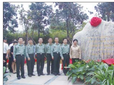
功勋航天员走进滨湖