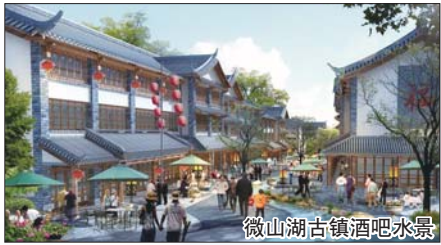
微山湖古镇酒吧水景