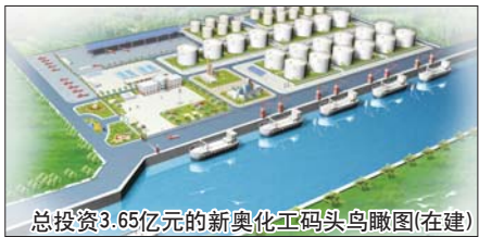
总投资3.65亿元的新奥化工码头鸟瞰图(在建)

科学跨越春风劲,旅游发展正当时。如今的滨湖镇正如小荷才露尖尖角,焕发着勃勃生机,孕育着跨越发展的巨大能量。今后,滨湖镇党政一班人将倍加珍惜省市各级重视旅游服务业发展的重大战略机遇,倍加珍惜全镇服务业发展取得的宝贵成果,进一步深挖资源潜力,培植产业优势,全力提升旅游发展层次和水平,力争尽快把滨湖打造成滕州市文化旅游副中心城市、国内乃至国际知名旅游目的地,建设成省内最具特色的健康养生、生态旅游名镇。