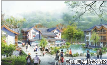
微山湖古镇客栈区