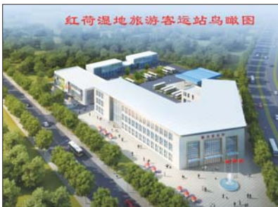
在建的红荷湿地旅游客运站