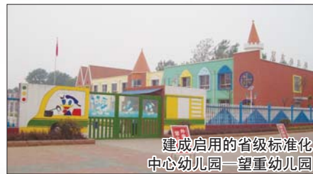
建成启用的省级标准化中心幼儿园一望重幼儿园