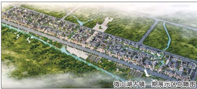
微山湖古镇一期展示区鸟瞰图

大旅游产品研发,扶持发展特色旅游产品加工产业、企业、农家乐、渔家乐等特色餐饮业初具规模,蛋制品、藕粉、荷叶茶等旅游产品加工业发展迅速。“湿地渔家”成功创建为全省农业旅游示范点,全镇旅游相关产业年实现产值达10亿多元。微山湖湿地已成为滕州乃至枣庄最具竞争力的旅游品牌和最具吸引力的靓丽名片。