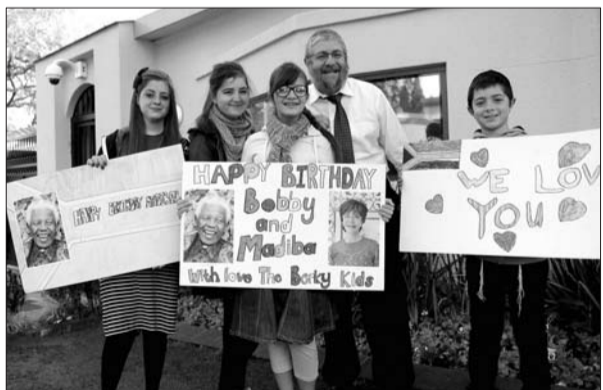
7月18日,一些市民来到曼德拉在约翰内斯堡的住宅前,祝贺曼德拉95岁生日。

在碰撞之处,金只是以原子形态出现,像原子雾一样在星空间飘荡。科学界推测,在地球形成早期,外来小型星体不断“轰炸”地球表面,把金原子带到地球。数十亿年来,地球地理状况不断变化,加之金元素本身属于惰性元素,不易与其他物质发生化学反应,因而逐渐形成固态单质黄金。