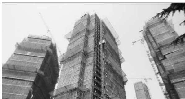
图为市区一在建楼盘。

绍,由于统计方法不同,国家统计局发布的数据与中国指数研究院发布的数据有所不同,中国百城指数显示青岛房价环比涨幅波动较大,而国家统计局