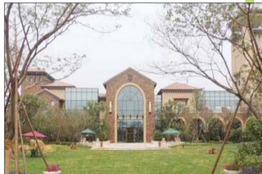
世茂诺沙湾实景图。