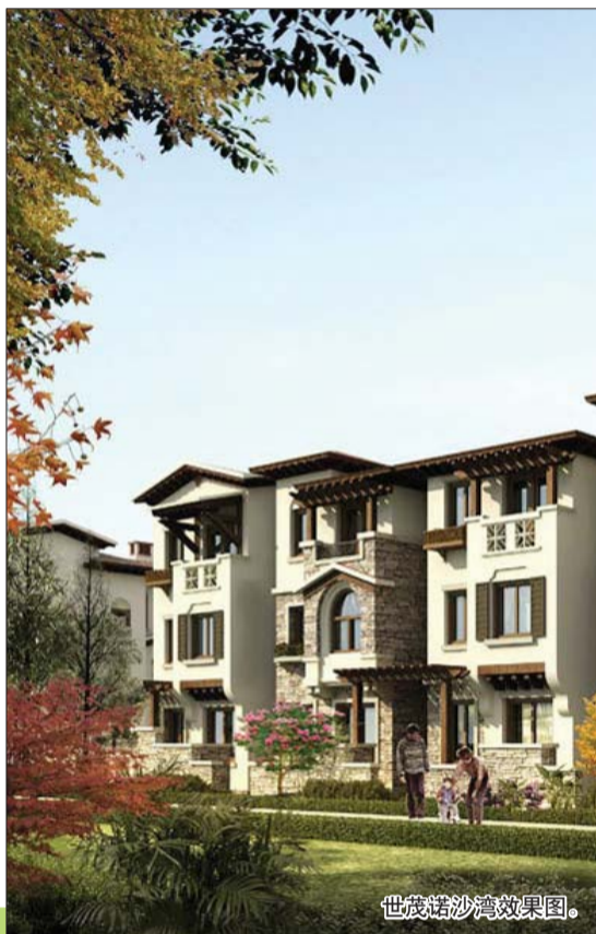
世茂诺沙湾效果图。

本报7月18日讯(记者潘旭业) 齐鲁晚报5月份组织东营、淄博两地市民赴青岛选房,在金茂湾项目当场成交了价值约500万元的房产,得到了开发商和购房者的极大认可。7月27日,齐鲁晚报免费看房车将再次出发,带领东营、淄博两地市民到青岛西海岸淘房。