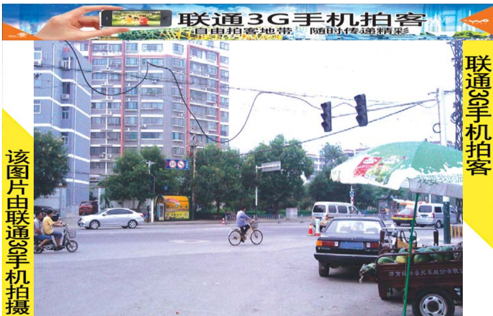
该图片由联通3G手机拍摄