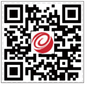
齐鲁晚报·今日滨州微博二维码