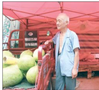
这位卖瓜人也面带愁容。

苏福强告诉记者,近几年,很多地方的人都到他们村取经,但是学习完技术之后,很少有人去实践,即使有人愿意做尝试,但是失败之后又放弃了大棚种瓜的方式。