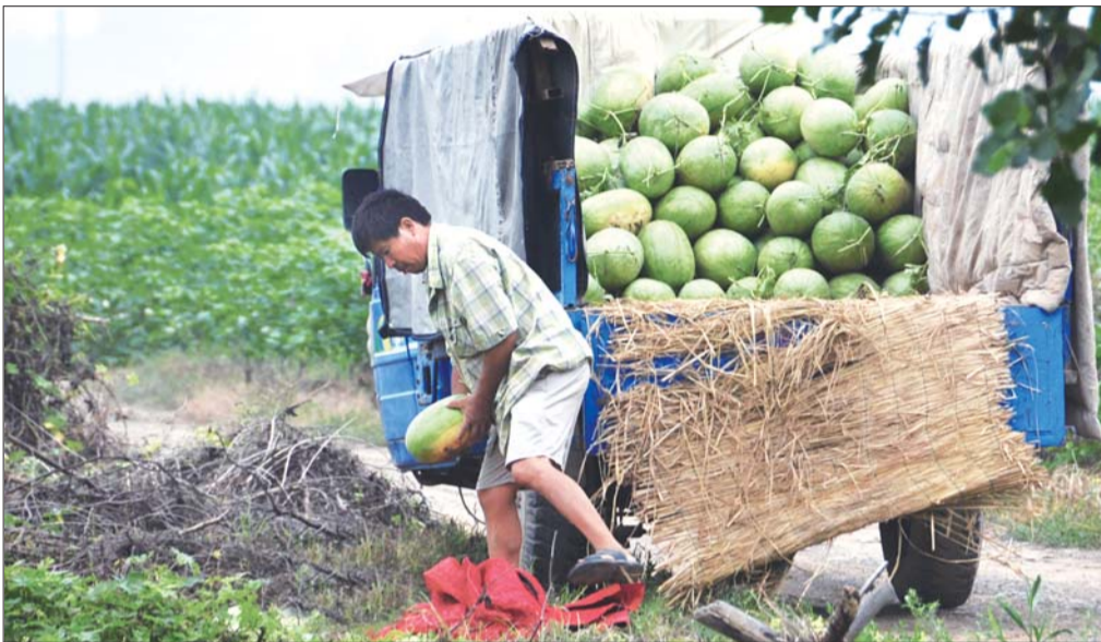
瓜农扔掉烂掉的西瓜。

连绵阴雨、瓜价直跌,金乡瓜农辛苦了四五个月,到头来白忙活一场。究其原因,有天气的不可抵抗因素,也有盲目跟风种瓜的人为因素,还有落后的营销模式,……上述因素,让金乡的瓜农有苦难言。和金乡瓜农相比,泗水瓜农种植了大棚西瓜,这种西瓜价格一路上扬,他们今年则大赚了一笔,亩产的受益比去年增加2000至4000元。