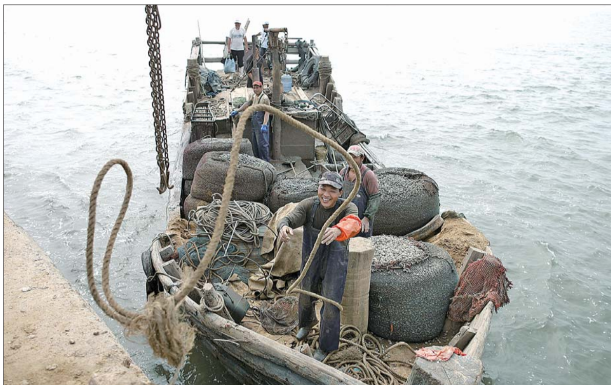
红岛特殊的泥质滩涂适宜蛤蜊的生长。图为渔民满载收获的蛤蜊归来。