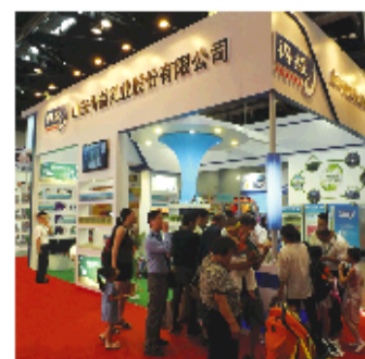
▲来自世界各地的消费者争相品尝梅盖牛奶

7月26日, 第五届中国(北京)国际妇儿产业博览会在北京国家会议中心隆重开幕, 来自国内外的众多知名乳企参展。梅盖乳业作为低温奶行业的代表亮相博览会, 并一举摘得三项大奖, 成为本届展会的大赢家, 在国际舞台再次展现了山东乳企的品质魅力。