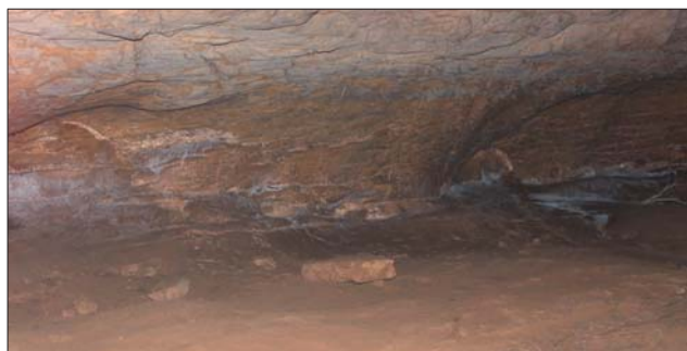
透明洞里的天然石床