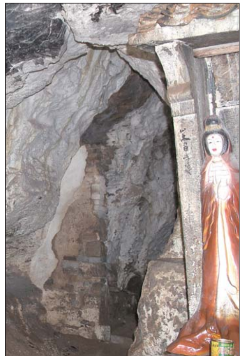
朝阳洞里的洞中洞