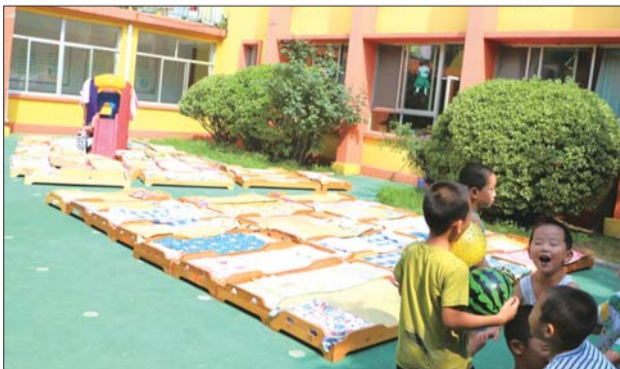
小朋友们淘气地凑到小床边。

在一旁看守的张老师一边笑着“驱赶”顽皮的孩子,一边有点着急地说:“今天一定得晒透,今后孩子中午就能睡个不潮的舒服觉喽。”