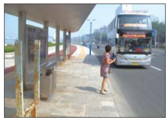
公交站点没有了“说明书”。

本报热线6610123消息(见习记者 蒋大伟) 24日,记者接到市民反映,市区滨海中路路东的武警总疗养院公交站点的站牌不翼而飞,给附近到海边游玩的市民和游客带来不便。