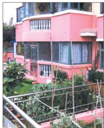
一楼前被开辟出的菜园。

王先生最后称,目前能达到最大的退步就是测量小区内每栋楼前花园的宽度,然后取平均值,若是不超过平均值半米,他便不会再有异议,“我主要是觉得小区的公共绿地是大家共有的,谁都不能破坏公共区域,给自己图方便。”