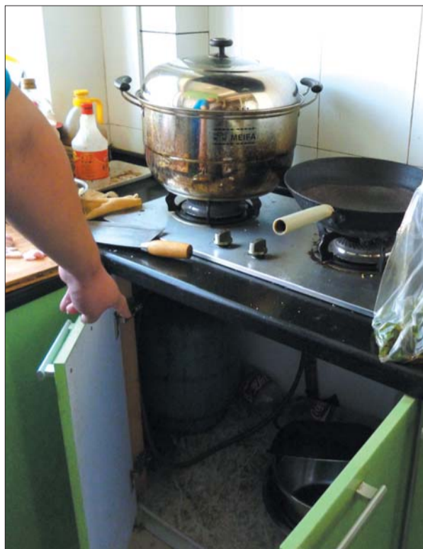
一位居民家里用煤气罐做饭,但花费要比天然气多。

对于开发商收取居民燃气投资费余下的5.4万元和暂扣大众燃气公司的4万元,朱世德说,如果小区燃气投资需要,这笔钱将全部用于燃气投资,“其他都给大众燃气了,开发商现在也无能为力啊。”