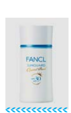
FANCL防晒隔离露30号透亮版 参考价: 258元

卓越护肤配方,独具抗老亮白及UVA/UVB双防护功能,是女性寻求周密防护与完美遮瑕双重功效的理想之选。富含柔和色调的质地,确保完美遮瑕,令肌肤全天候亮采动人。有效防护并增强亮肤,肌肤焕现全新光采。轻抹间,肌肤立感柔软丰盈,肤色匀净清透,宛如轻覆一层剔透薄纱,令肌肤防护、舒适一整天。