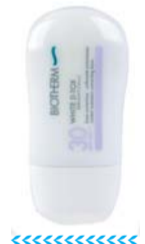
碧欧泉CC霜 参考价: 390元

防晒霜的作用原理是把皮肤与紫外线隔离开来,有效预防黑色素的产生。防晒产品是个大护肤品夏季主推的系列,无论是纯防晒单品,还是兼具防晒美白功效的隔离类防晒产品,在这个夏季,都为你的肌肤撑起一把“保护伞”!