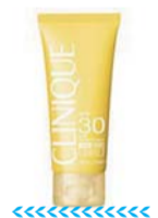
倩碧面部防晒霜 参考价: 260元

在色彩护肤方面, CC霜拥有强大的隔离与保护功效,全新碧欧泉CC霜提供最高级紫外线防护SPF50+,同时协同碧欧泉水光莹亮美白精华核心成分——滢海亮白科技,帮助从源头抑黑,抵御肤色问题的产品,提供缤纷色彩修护。