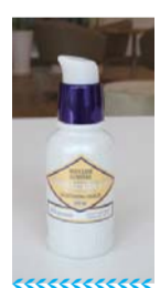
欧舒丹蜡菊焕白防晒乳 参考价: 400元

提供高效防晒保护,可抵御UVB/UVA对皮肤伤害,预防UVA会造成皮肤过早衰老,并及时修护皮肤受紫外线照射后产生的伤害。面部防晒产品中还含有浮游生物精华,能在受到UV伤害时释放“修复”酶,帮助对抗诸如胶原蛋白流失等肌肤可见伤害。