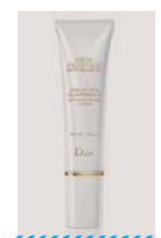
迪奥花蜜活颜丝悦亮肤遮瑕防晒乳 参考价: 950元

欧舒丹首款面部防晒产品,清爽配方蕴含蜡菊、雏菊、金莲花精萃等植物净白复方与维生素E,以微脂囊包覆纯净的蜡菊精华油,可有效预防肌肤受阳光照射导致的光老化,增强肌肤弹力与张力。萃取自地中海原生雏菊精萃可均匀提亮肤色,令肌肤自然绽放亮采白;全新晶亮因子金莲花精萃,帮助焕白肌肤;月见草油、琉璃苣油修护紫外线侵害的肌肤,维持肌肤青春与弹性。