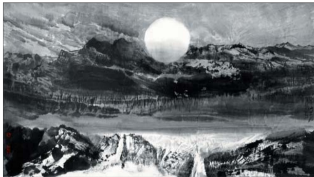
▲长河颂月 85x190cm 吴建军

“冷”与“空”可以说是吴建军水墨山水的两大基调。他的“冷”既见寥廓江天万里白霜,又闻黄河滔滔马鸣啾啾,他的“空”既是日月幽谷,水天一色,又是清静晨光,佛光正道,清冷之下有连绵不绝的意境与韵味。吴建军的山水画中时常有一轮钩月斜挂天际,冷月不但为营造画面气氛起到了举足轻重的作用,更以月光的清冷衬托出作者的人文关怀。之所以关注作者画面中这一符号式的绘画元素,更重要的也许是对作者绘画中展现的寂寥空阔的气氛的关注。画家的这种人文关怀是一种孤独,一种寂静,一种清幽,也许更是一种对自然山水,对社会及人生的冷静思考,我们不知道作者在思考什么,但看得出是冷静谨严和认真含蓄的,这也许是令读者对画面可以耐心琢磨的缘