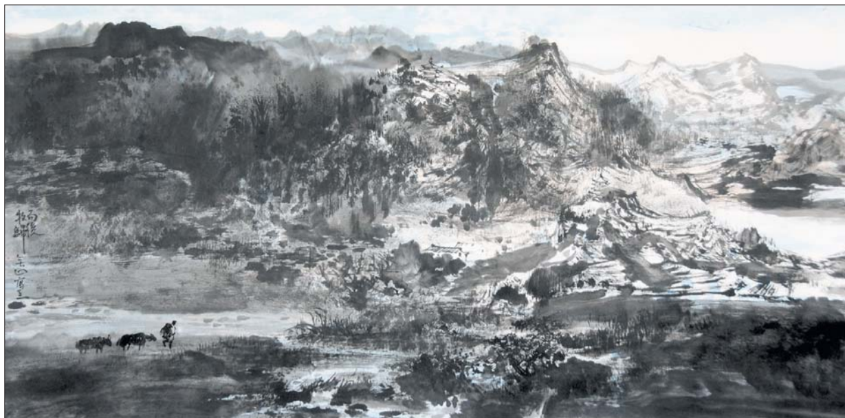
▲雨后牧归 69x138cm 吴建军

笔名,无山,1962年生于莱芜。1985年毕业于山东工艺美术学院工艺绘画系。现任济南市文联副秘书长、协会工作部主任,系中国美术家协会会员,山东省美术家协会副秘书长,山东省致公党书画院副院长,致公党济南市委文化艺术委员会主任,济南市美术家协会常务副主席,济南市政协常委。