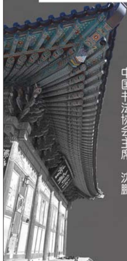
中国书法家协会主席:沈鹏