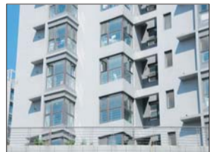
在天合城小区,窗台前都安装了护栏,目测有一米高。

“安装防护网不一定能保护孩子。”市民马先生说,如果防护网之间的间隙设计得不合理,很