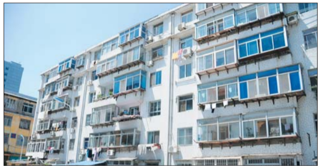
在华茂小区一栋老住宅楼上,只有底层住户安装了防护网。