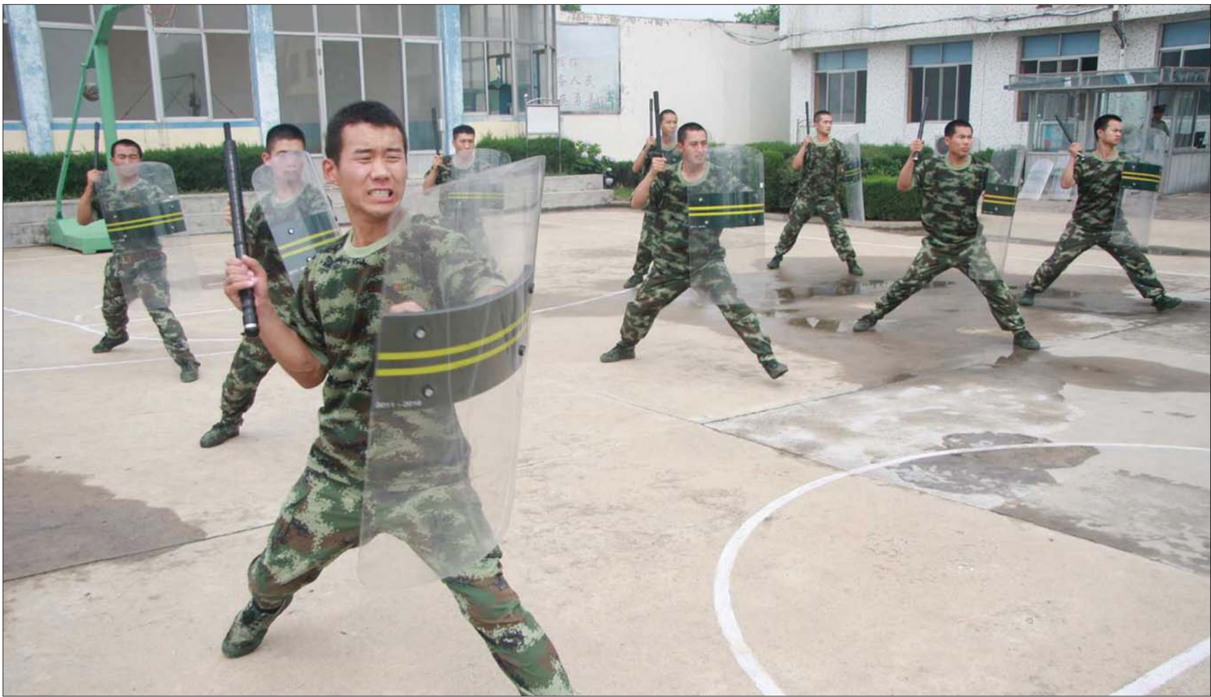
战士们不畏烈日,进行军事训练。