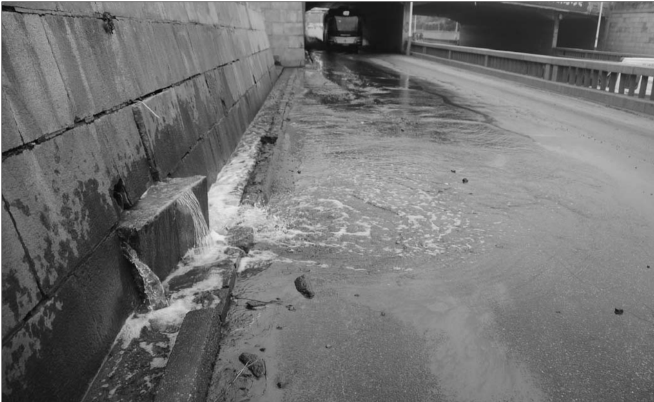
带有强烈刺激性气味的污水不断从路旁的污水管道中涌出。