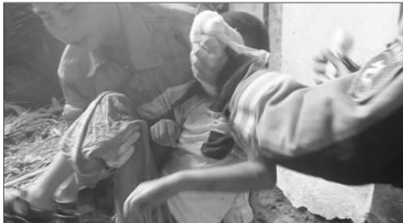
孩子被成功救出。

由于现场较为混乱,民警让围观群众先离开。赶来救援的人员经过二十分钟的紧急救援,将孩子救出。现场的医护人员赶紧对孩子进行检查。据了解,孙某儿子无生命危险。