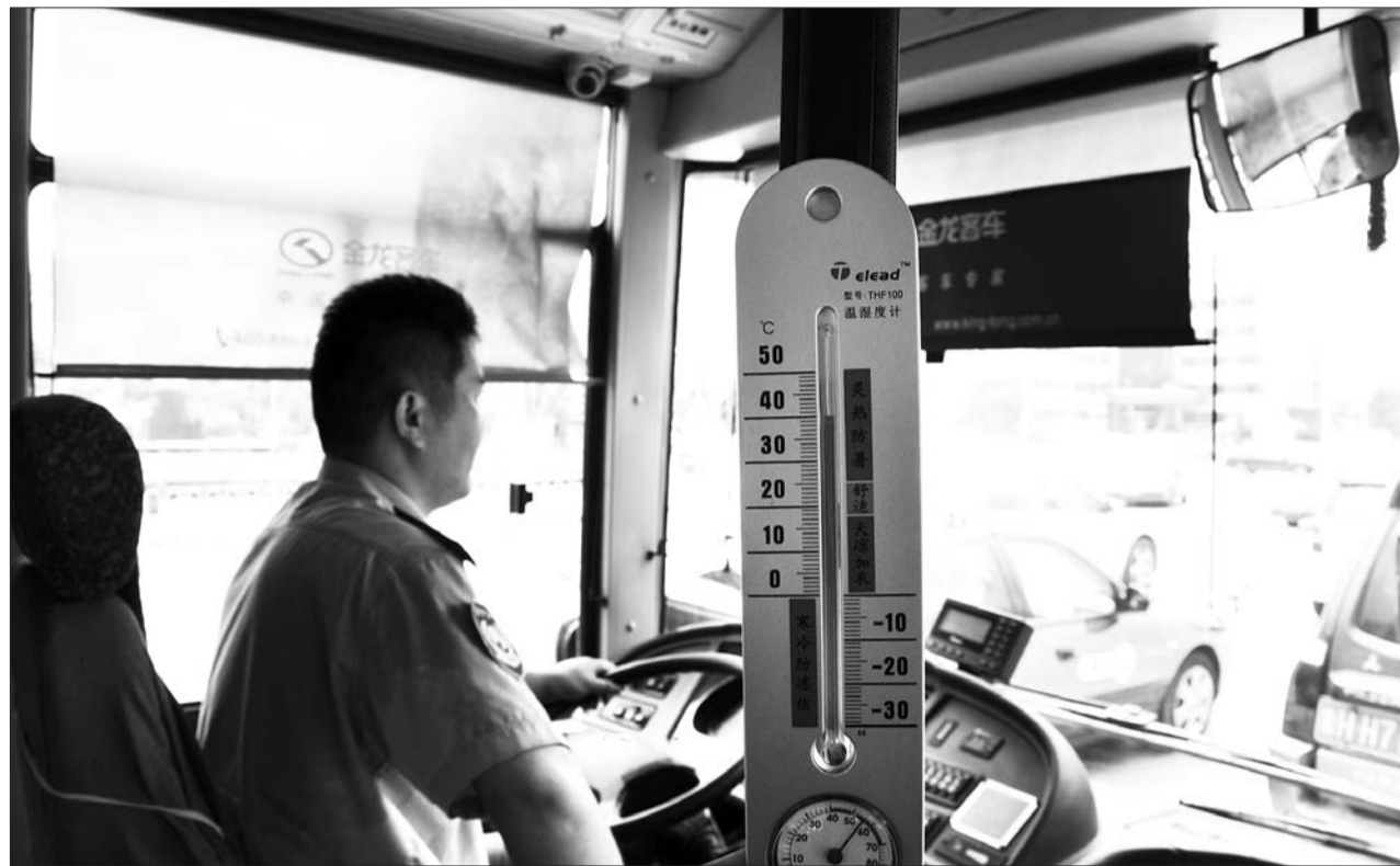
车内温度已达到40度。

太白楼中路一家银行的大堂经理张明介绍,有的市民在大厅里一坐就是一、两个小时,还有带孩子过来的,还有在大厅里吃东西的。他表示,市民在这坐歇歇脚是可以的,希望市民注意公共场所的环境卫生,不要给其他市民带来过多的不便。