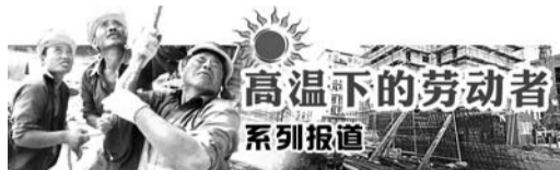
高温下的劳动者 系列报道

在热浪滚滚的城市里,有一群公交车司机,他们手握方向盘、紧绷安全弦,坐在蒸笼般的公交车里,周而复始地穿梭于城市的大街小巷。即使在小吊扇下开车,身上的衣服也经常被汗水打湿。