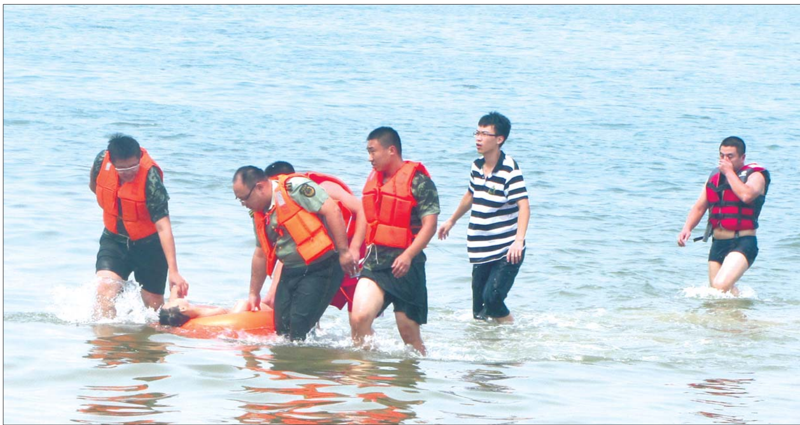
救援人员将溺水男孩救上岸。