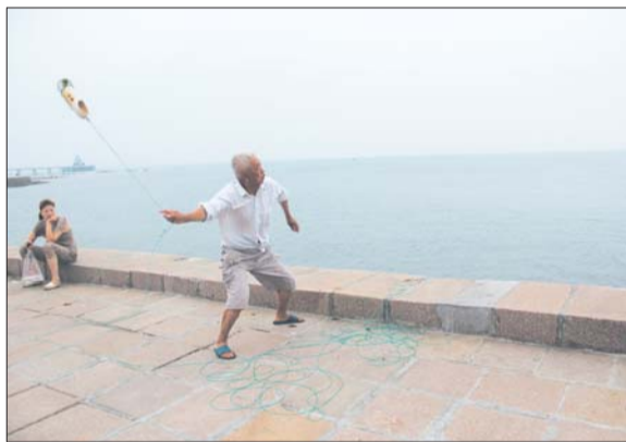
“呼呼”转两圈,蟹笼入海啦!

最终,其中一小桶螃蟹被一名女士买走了,她告诉记者:“25块钱买这么多野生螃蟹,确实挺值的,今天赶巧碰上了,买回家做给孩子吃去。”