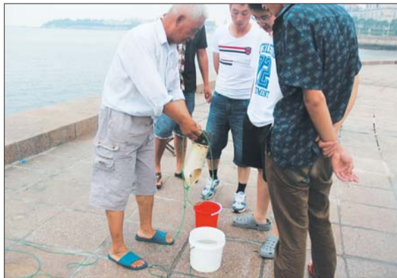
蟹笼提了上来,看看收获咋样?