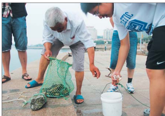
今儿的螃蟹挺不错,一名小伙也买了些。