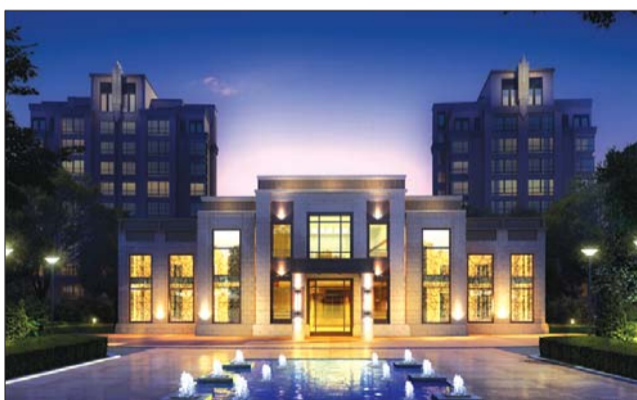
恒基·都市森林-会所夜景。

“每一个人心中,都有一片属于自己的森林。在城市化进程与生活节奏日益加速,污染与喧嚣与日俱增的今天,奢侈早已不仅体现在专属标配和至尊体验,更在于每一次洁净的深呼吸;人们所追求和向往的,早已不仅是物质生活的丰裕,更是回归自然的健康与本真。”为此,都市森林项目甄选了100余种名贵绿植,全冠移植3000株大树,还将在小区养育200余尾灵动锦鲤,实现都市的先进便利与自然的清新纯美结合,让每一位业主在泰山脚下住上可以比肩北上广深一线城市绝版豪宅。此次开工建设景观示范区,令人颇为期待。