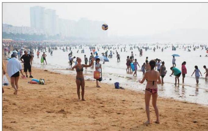
威海的国际海水浴场吸引了众多国外游客。

“千里海岸线，一幅山水画”，这既是威海的旅游宣传语，也是整个城市的真实写照。这个荣获过联合国人居奖的城市，拥有温和的阳光、柔软的沙滩、美味的海鲜，以及相当数量的温泉和高尔夫球场，这些自然也博得了众多老外的青睐和热捧。在很多机构评选的“外国人最爱的中国旅游城市”中，威海都入选了“第一梯队”。