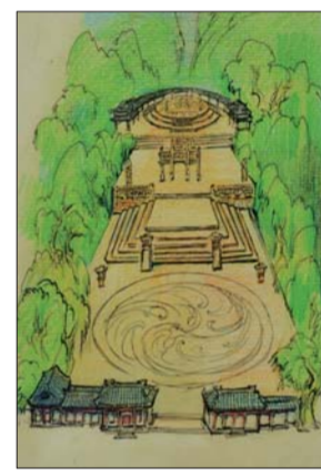
千佛山南坡的舜坛手绘图。