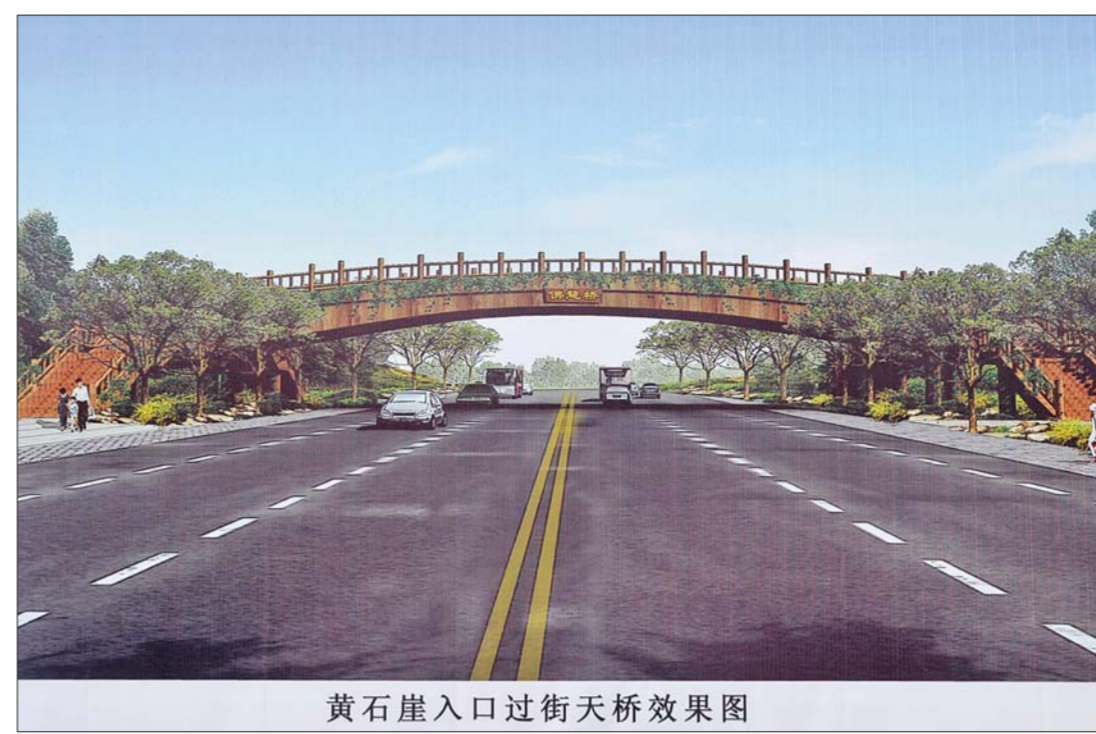
黄石崖入口过街天桥效果图

拦蓄下来的雨水不仅能够打造水体景观,还可以用作绿化用水。另外,佛慧山沟谷也有不少渗漏带,雨水逐渐下渗后可以补给地下水,保证泉水持续喷涌。