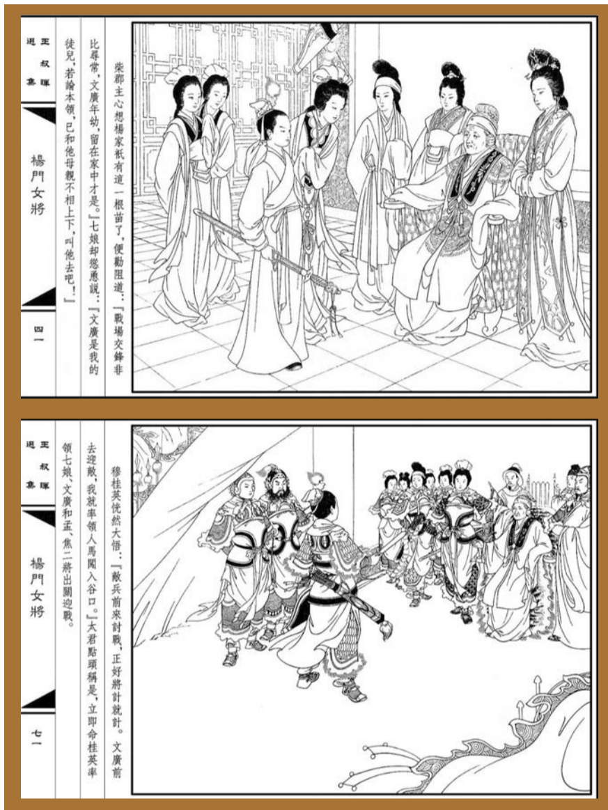
杨门女将连环画内页之一

收藏连环画也是有窍门的。首先,对于一般收藏爱好者来说,收藏连环画的首要条件必须腿勤、耳朵灵。勤逛地书摊,勤跑废纸收购站,久而久之必有收获。其次,平时要多阅读一些有关连环画的资料和较专业性的报刊杂志,以提高自身的文化素质和鉴赏水平。这样才不至于人云亦云,盲目购藏。第三,因连环画的拍卖价与市场交易价差距很大,其拍卖价中不能排除广告效应、炒家联手哄抬等诸多因素,水分是相当多的,故只能作为参考。而那些缺皮少页、乱涂乱抹、生了霉斑的连环画,除了存世极为罕见的以外,实属垃圾品,不在收藏范围之内,初入连环画收藏的朋友一定要特别注意。(王云志)